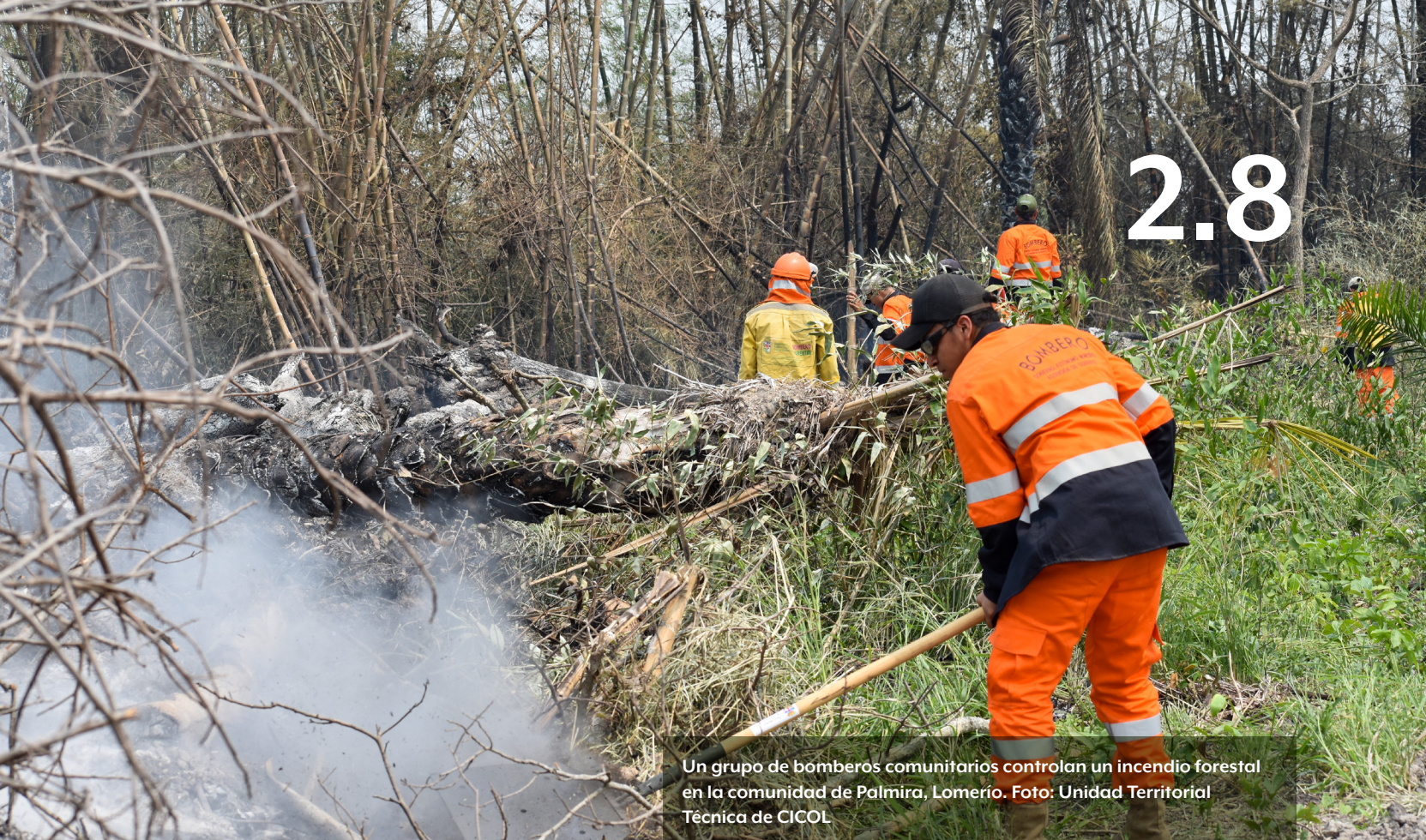
Un grupo de bomberos comunitarios controlan un incendio forestal en la comunidad de Palmira, Lomerío.