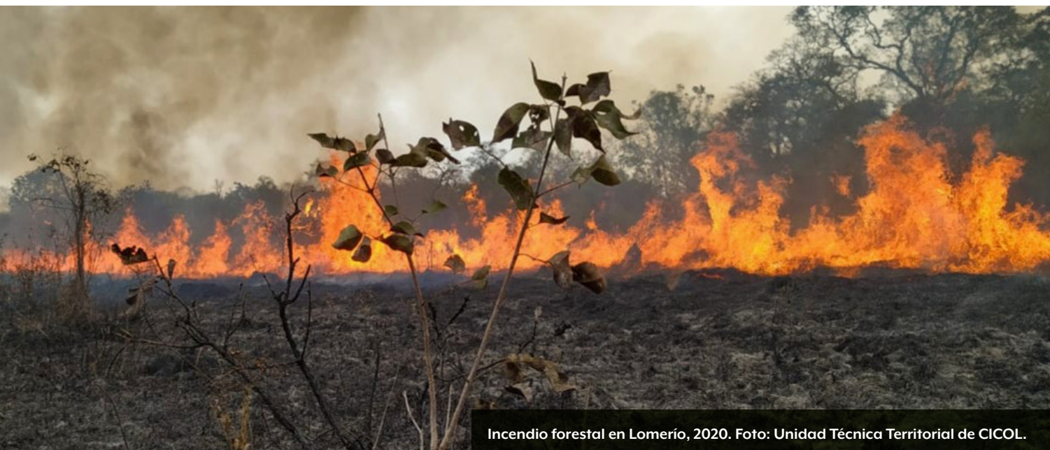
Incendio forestal en Lomerío, 2020.

contribuye a la conservación de la tierra y los bosques. En su cosmovisión, el uso del fuego se encuentra en equilibrio con el ambiente y es clave para el bienestar de sus comunidades. Esto contrasta fuertemente con los modelos agroindustriales, que son actualmente la mayor amenaza para el medio ambiente y están provocando la destrucción de grandes extensiones de bosques en el país, la región y el mundo.