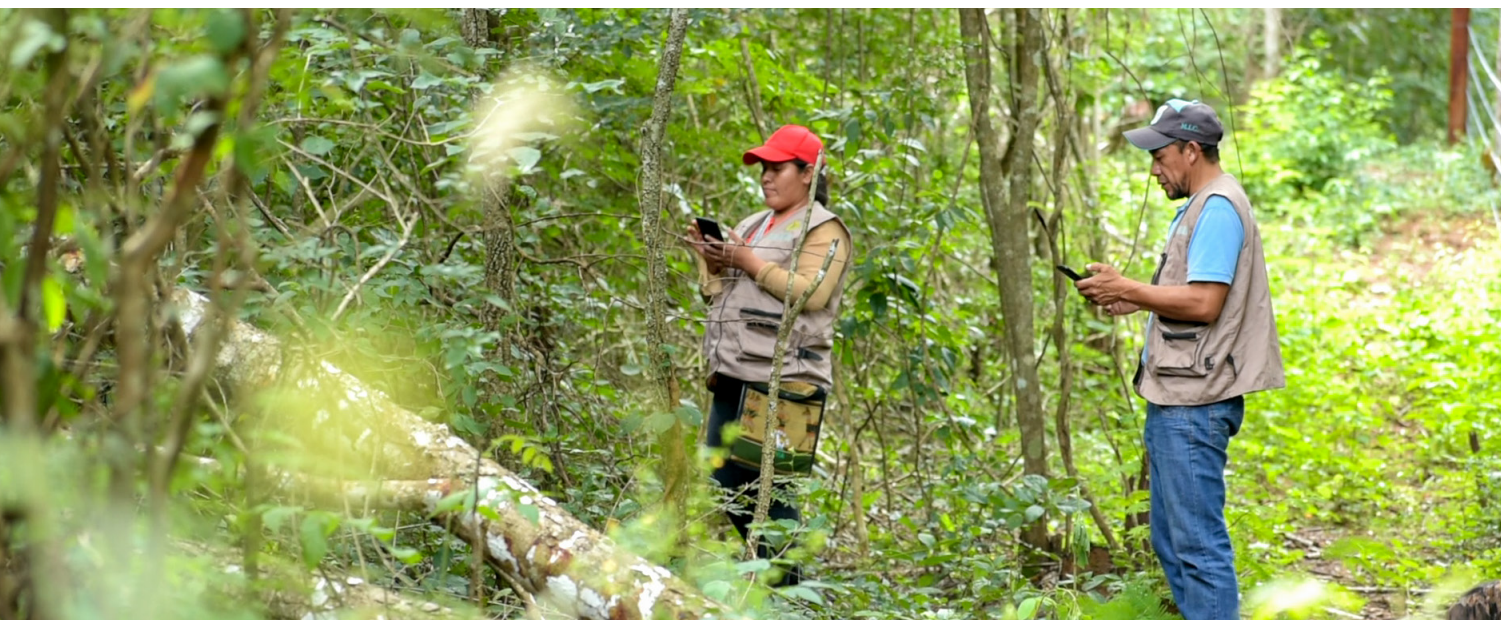
Monitores ambientales de la UTT de la CICOL verificando el área deforestada, Lomerío.