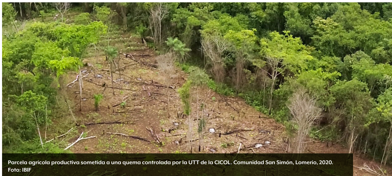
Parcela agrícola productiva sometida a una quema controlada por la UTT de la CICOL. Comunidad San Simón, Lomerío, 2020.

Esto condujo a la CICOL a tomar la determinación de abordar urgentemente la gravedad de la situación, basándose en una clara comprensión del carácter cíclico de los incendios forestales. Así, procedieron a desarrollar procedimientos y mecanismos internos para reducir significativamente los riesgos de incendios forestales mediante un mejor manejo del fuego.